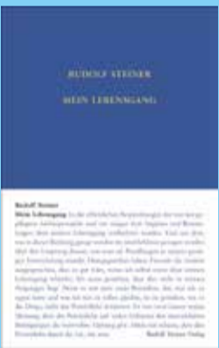
Rudolf Steiner Mein Lebensgang