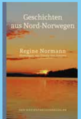
Regine Normann Geschichten aus Nord-Norwegen