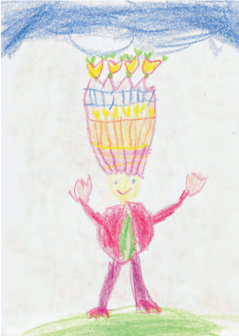
Abbildung 1: Die feinsinnige Empfänglichkeit eines hochsensiblen Kindes, Mädchen, 5 Jahre