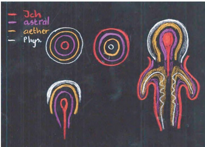
Tafelbild von Rudolf Steiner aus dem Heilpädagogischen Kurs, GA 317