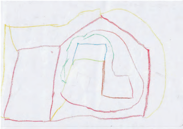
Abbildung 2: Die strichbetonte Darstellung eines Hauses, Junge, 5 Jahre

Es erscheint mir wichtig, diese Kinder miteinzubeziehen, damit Erziehung heilsam werden kann.